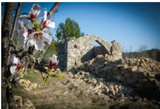
Chapelle Saint-Symphorien d'Agel, Aude(II)

Los intercambios comerciales que se remontan a la Antigüedad, en particular de metales, utilizan esta vía que permite el acceso a los grandes puertos : Béziers, Agde, Narbona así como el enlace al Atlántico o bien a las factorías británicas.