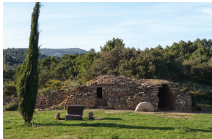
Capitelle de Félines-Minervois, Aude(II)

El trazado del camin romieu precisa: « La ruta moderna que va de Beziers a Carcasona ha tomado el trazado del camin romieu desde Beziers hasta Homps. Así, antes de llegar al puente de Cabezac, cerca de Bize, el antiguo camino pasaba un poco más al sur de la ruta actual: el catastro todavía lo designa bajo el nombre de camin romieu. »